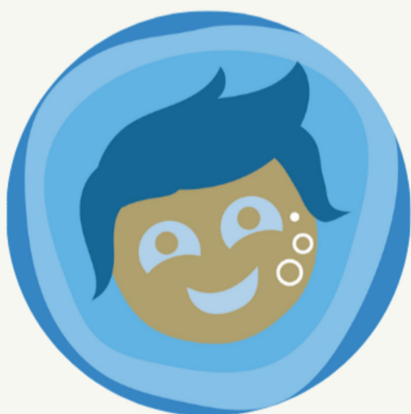
Unter Wasser sein