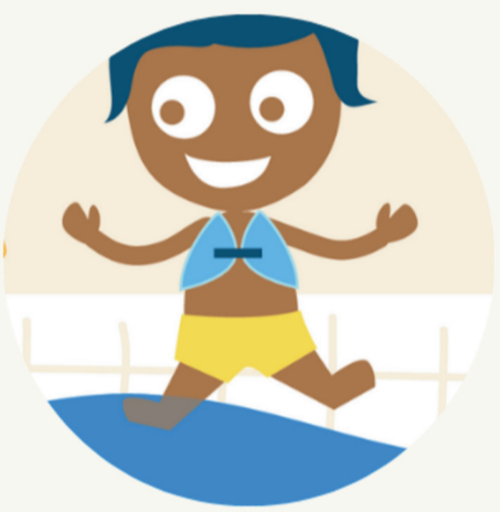
Ins Wasser gehen